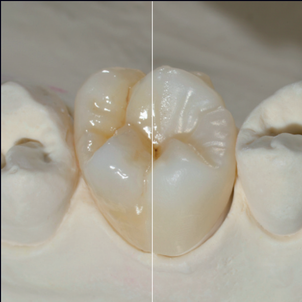
DD cube ONE® ML, Farbe A3,5 coloriert und strukturiert

Die Farben sind effektiv und decken kräftig, mit unaufdringlicher leuchtender Intensität.